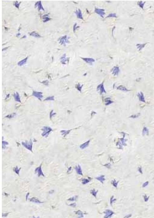
25 Carta di Riso