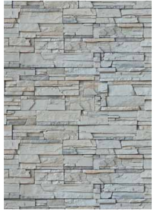
23 Eco Stone