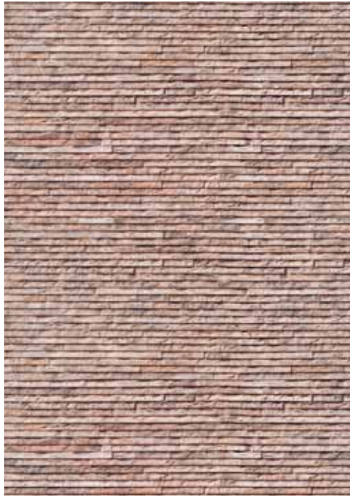
15 Porto Venere