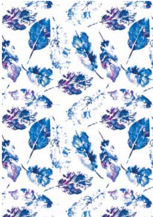
34 Flower Ink