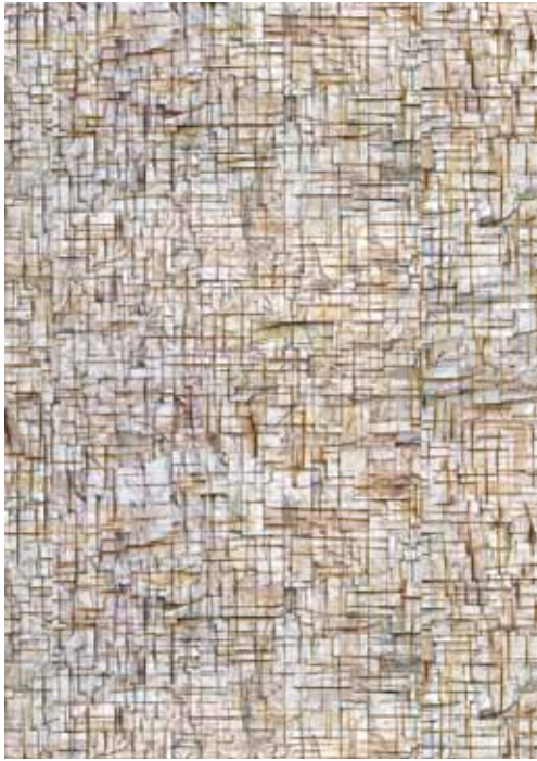
13 Cut Stone