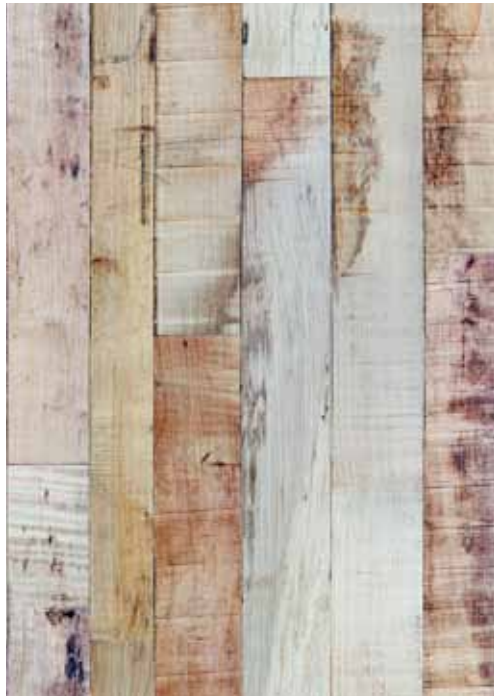
22 Old Tables